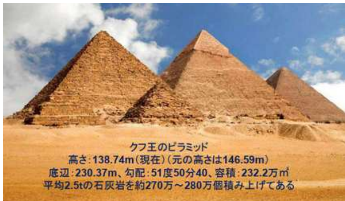
クフ王のピラミッド

高さ: 138.74m(現在)(元の高さは146.59m) 底辺: 230.37m、勾配: 51度50分40、容積: 232.2万m 3 平均2.5tの石灰岩を約270万~280万個積み上げてある