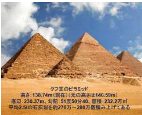
クフ王のピラミッド 高さ：138.74m（現在）（元の高さは146.59m） 底辺：230.37m、勾配：51度50分40、容積：232.2万㎡ 平均2.5tの石灰岩を約270万～280万個積み上げてある