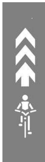
自転車ナビマーク