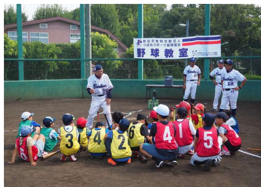
めぐろスポーツまつり