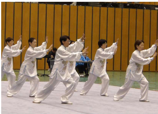
太極拳大会