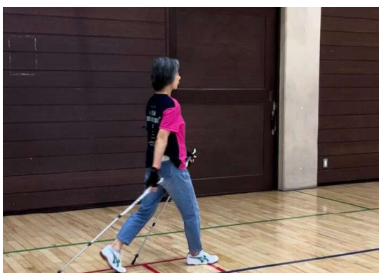
スポルテ目黒の活動