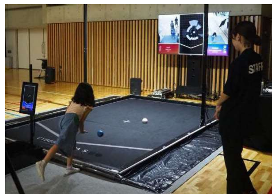
サイバーポッチャ