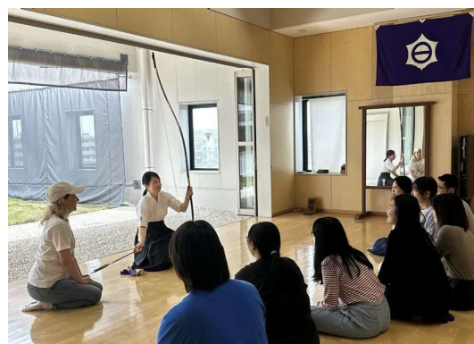
武道体験