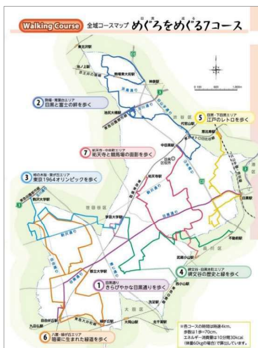
めぐろウォーキングマップ