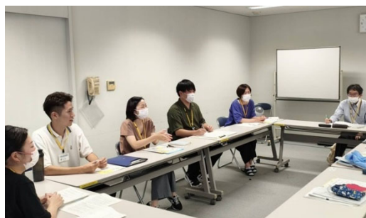
5地区のCSWと社会福祉協議会の担当者の皆さんが一堂に会し、ヒアリングを実施

CSWへの相談は、福祉的な問題だけでなく、隣家の庭木など住民同士の関係、ハトのフンや自販機のゴミなどまちの環境、道路、公園、住宅など、多岐にわたる分野に及んでいるが、住民同士のつながりの希薄化により、地域の中での解決が難しくなっている印象がある。CSWとしては、即時の解決は難しくても、声に耳を傾けて一緒に考える姿勢が大事だと考えている。「一期一会」を大切に、地域に出向き、様々な活動や人と出会い、顔と顔を合わせつながることがCSWの活動の基盤となる。そうしたつながりを生かし地域課題の解決や地域づくりに取り組んでいきたい。