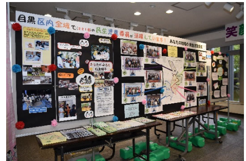
目黒区 民生児童委員活動 PR パネル展の様子