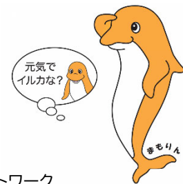
見守りネットワーク (見守りめぐねっと)のキャラクター まもりん