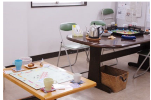
ほっとする雰囲気のカフェの店内 当事者の希望でフェアトレードコーヒーを扱う