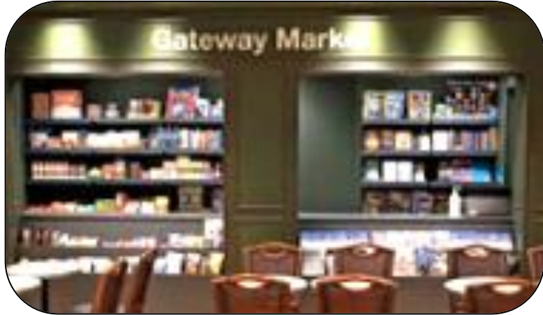
日帰り体験型英語学習