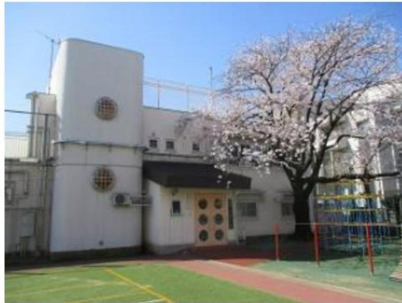
げっこうはらこども園