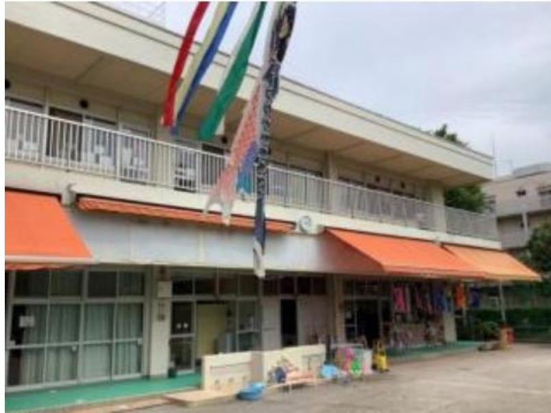
ひがしやま幼稚園