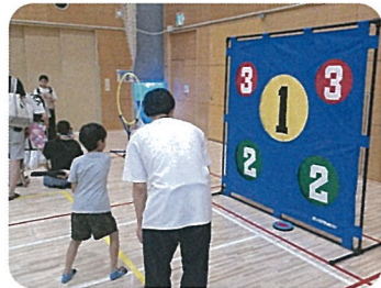
フリスビーターゲット