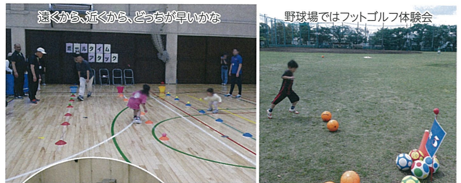
遠くから、近くから、どっちが早いかな

令和7年5月5日(月)碑文谷体育館にて「碑文谷フレンドパーク15」が開催されました。今日はこどもの日!長かった連休も残り2日。最後の快晴日に子どもたちはとても元気!野球場ではデュアルスライダーとフットゴルフ、体育室ではピンボールキャッチと巨人生ゲーム、それに新競技ボールタイムアタック。庭球場ではテニス教室、駐車場では模擬店もあり、多くの親子連れで大にぎわいでした。