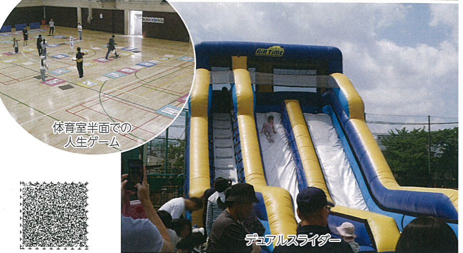
体育室半面での人生ゲーム