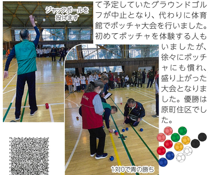
ジャックボールを投げます

令和7年10月26日(日)目黒西中学校にて「南部地区スポーツ大会」が開催されました。あいにくの天気で校庭にて予定していたグラウンドゴルフが中止となり、代わりに体育館でポッチャ大会を行いました。初めてポッチャを体験する人もいましたが、徐々にポッチャにも慣れ、盛り上がった大会となりました。優勝は原町住区でした。