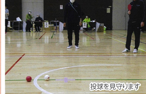
投球を見守ります

令和7年11月16日(日)碑文谷体育館にて「中央地区スポーツ大会」が開催されました。今年の種目は、昨年に引き続きポッチャです。ほとんど知らなかったという方、しっかり練習している方、世代や性別も様々な参加者が一緒に熱中していました。見事な投球が決まると、敵味方関係なく歓声が上がると、和気あいあいとした雰囲気の大大会になりました。