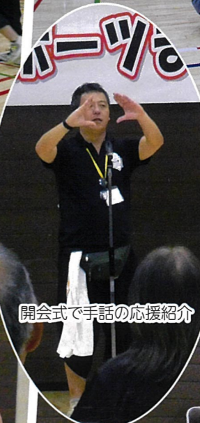
開会式で手話の応援紹介

■令和7年10月5日(日)「第23回めぐろスポーツまつり」が碑文谷体育館で開催されました。体育館では午前に新体力テスト、午後はポッチャの試合で盛り上がりました。スポーツ推進委員の広報ブースでは恒例の射的コーナーが賑わっていました。また晴天の秋空の中、野球場と庭球場ではティーボールやスナッグゴルフ、モルックなど参加者多数でルールなども確認しながらスタッフと一緒に楽しみました。