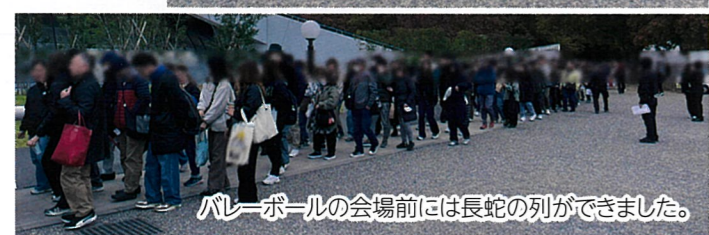
バレーボールの会場前には長蛇の列ができました。