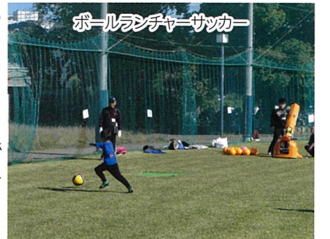
ボールランチャーサッカー

幼児リトミック。駐車場では、ウクレレ演奏・チャリティーバザー・模擬店。特に印象的だったのは、キッズダンスのキレッキレのカッコ良さでした。優雅なフラダンスにも見惚れてしまいました。子どもたちには、三連休最後の良い思い出になったでしょう。