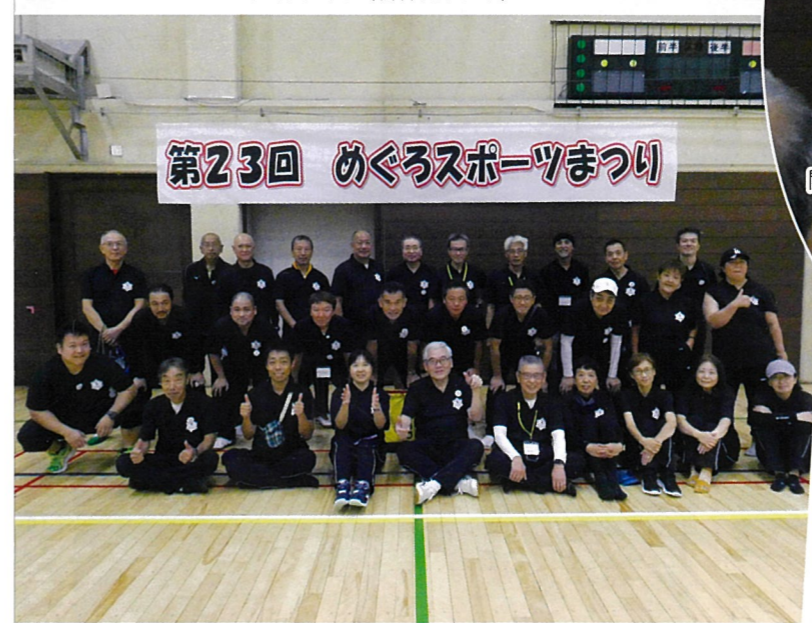
第23回 めぐろスポーツまつり