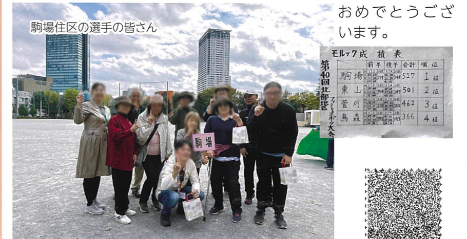
駒場住区の選手の皆さん

令和7年11月16日(日)第一中学校校庭にて「第40期北部地区ファミリースポーツ大会」が開催されました。当日は晴天に恵まれ、絶好のスポーツ日和でした。種目は、昨年までのグラウンドゴルフに代わり、今年は新競技であるモルックにて4住区対抗戦が繰り広げられました。モルックはお子さんから高齢者まで参加し易い競技でした。得点方法は、足し算をしながら50点を目指しますが、なんと試合中に50点が12回も出ました。優勝は駒場住区でした。