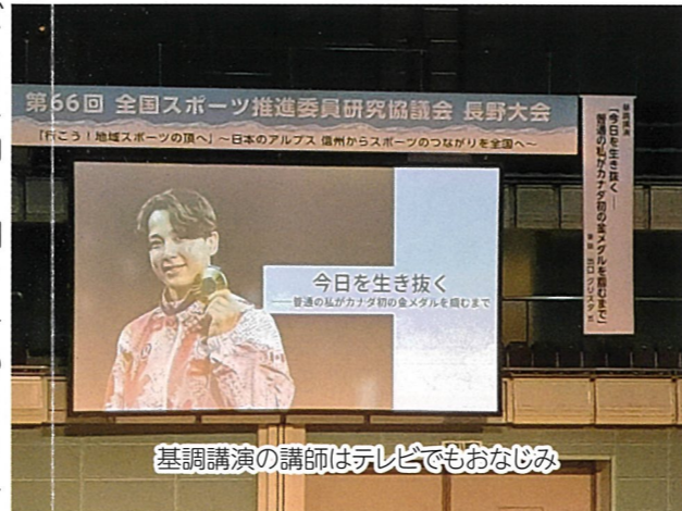
第66回 全国スポーツ推進委員研究協議会 長野大会