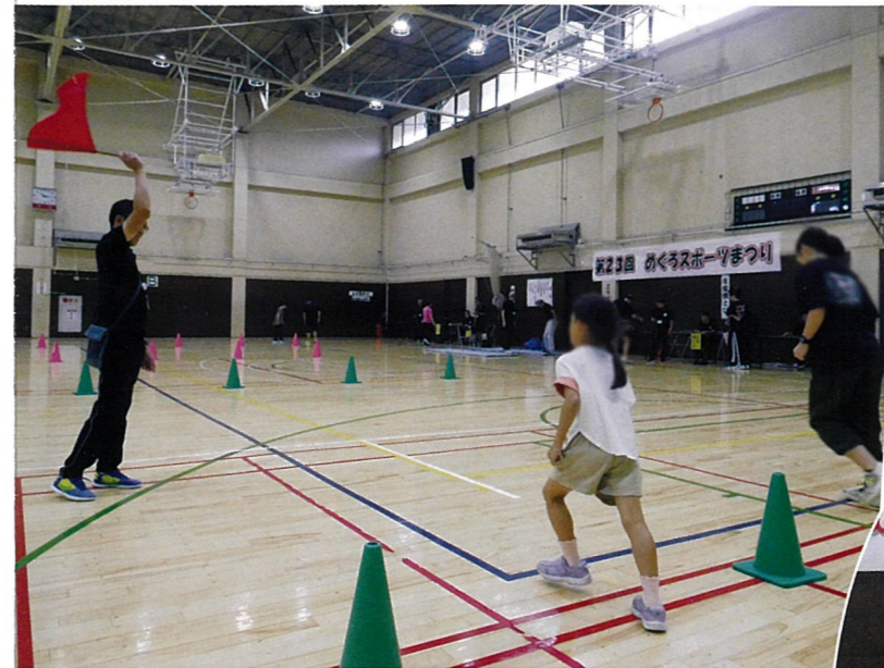
シャトルラン(新体力テスト)