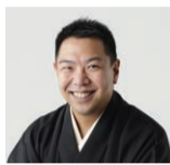
九代目春風亭柳枝氏

九代目春風亭柳枝氏、三遊亭れん生氏、 目黒区民まつり実行委員長など ※一般観覧の一部のかたにも、審査に 参加していただきます