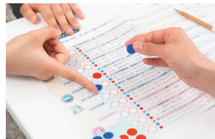
フレイルチェックシート