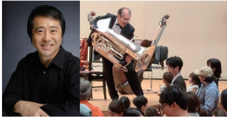
宮松重紀 (21世紀指揮者)