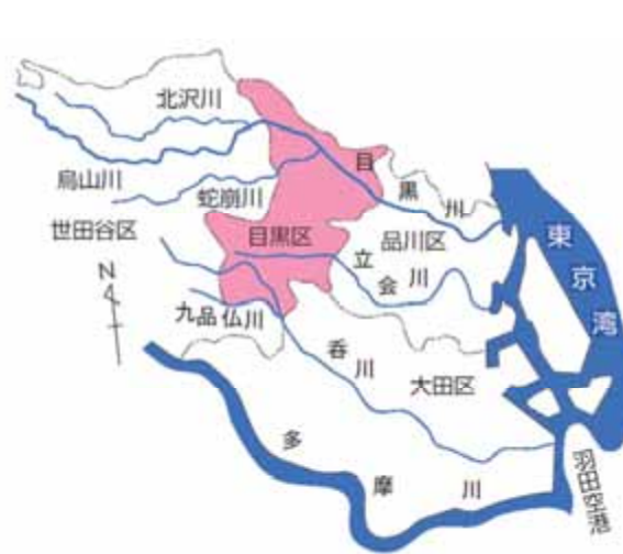
図 目黒区の水系(2000:目黒区基本計画より)

緑被率*は17.3%で東京23区中13位、開渠(水面が見える)となっている河川は、目黒川の大橋より下流、呑川の緑が丘3丁目の下流です。