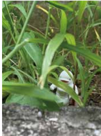
三分割構図を意識して撮影しました。鮮やかな緑の中にぼつんという白イルカ。なんとも言えない独特の雰囲気を作り出したように意識しました。(咲羽)