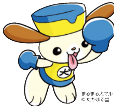
まるまる犬マル © たかまる堂