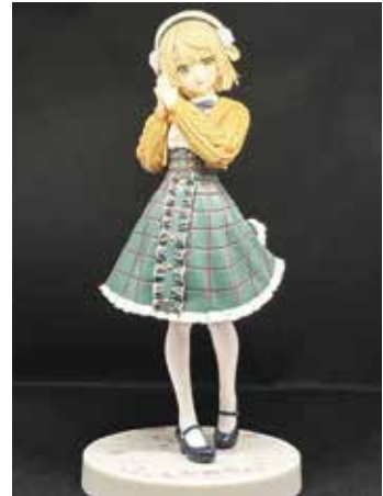
家にあった母の撮影セットで撮りました。明るいフィギュアなので、色がくっきり見えるように黒背景にしてみました。今回は用意できなかった脚の陰影が綺麗で、より脚をすらっと見せている良い写真ですね。