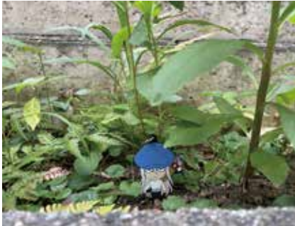
写真を撮る際に、構図や明暗を考えるのは初めてだったので難しかったです。外の撮影では自然を写真の雰囲気とストーリーに落とし込むのが楽しかったです。キャラクターの特徴と、草や木々のイメージを合わせることができて良かったです。(北嶋悠)