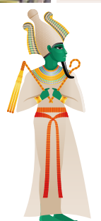
オシリス 冥界の神