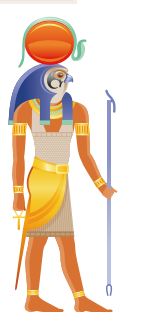
太陽神ラー 天と地の創造者