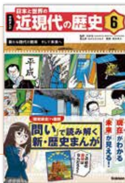
監修：高橋哲 原作：南房秀久 まんが：おがた たかはる (Gakken)

「日本と世界の近現代の歴史6」は、おがたさんが描いた漫画の中でも、特に中高生におすすめらしいです。この本では、近代~現代の歴史を漫画でわかりやすく説明していて、勉強にもなるので、ぜひ読んでみてください!