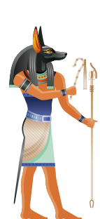
アヌビス ミイラ作りの神