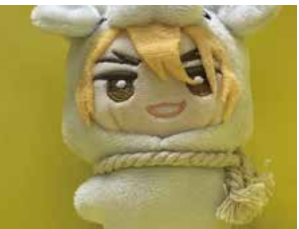
全体的に明るい写真にしたかったので、被写体の後ろを明るい色の背景にしました。明るい色の中でも、黄色が被写体と相性が良かったので、黄色の背景を使って写真を撮りました。被写体を綺麗に写真におさめることができて良かったです。(美穂)

キャラクターの髪の色に合わせて、背景の壁紙を選んだことで、よりキャラのイメージが強調されていて良いね。