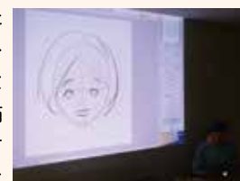
▲目の位置が変わるだけで、年齢が若く見えたり、老けて見えたりするところを実際に描いて見せていただきました。

似顔絵では、顔の輪郭が丸いか四角いか、縦長かそうでないか、髪型などを見ながら、各パーツ(目や口など)の大きさや位置、角度をよく観察して描くそうです。パーツの位置は年齢を表す重要なヒントとなります。目の位置を低く、目と目の間隔を狭くすると幼く見え、反対に高く広くとすると大人びて見えます。キャラをつくる時は、顔や髪型に特徴を持たせたり、全身をシルエットにしてもそのキャラとわかるように考えて描くと、人に伝わりやすいものになるとのことでした。