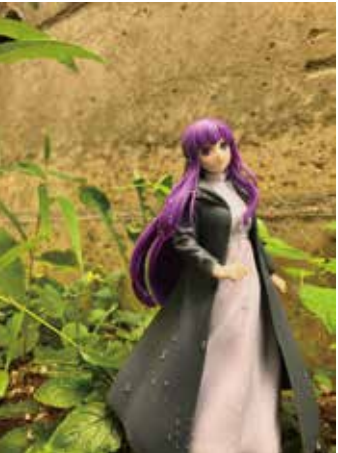
写真内の三分割構図を意識して写真を撮りました。頭の中でイメージを広げることによって、綺麗な構図で写真を撮ることができました。また、フィギュアや周りの草に水をつけることによって、「雨がやんで晴れた」というシチュエーションを再現しました。(杏心)

三分割構図を意識したキャラクターの配置と光の向きが相まって、より立体的に見えるのが良いね。水滴を使い、さらにリアルさが出ています。