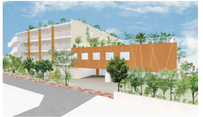
施設完成イメージ図

特別養護老人ホームに加え、小規模多機能型居宅介護・認知症対応型通所介護(地域密着型のデイサービス事業所)を一体的に運営する複合施設です。