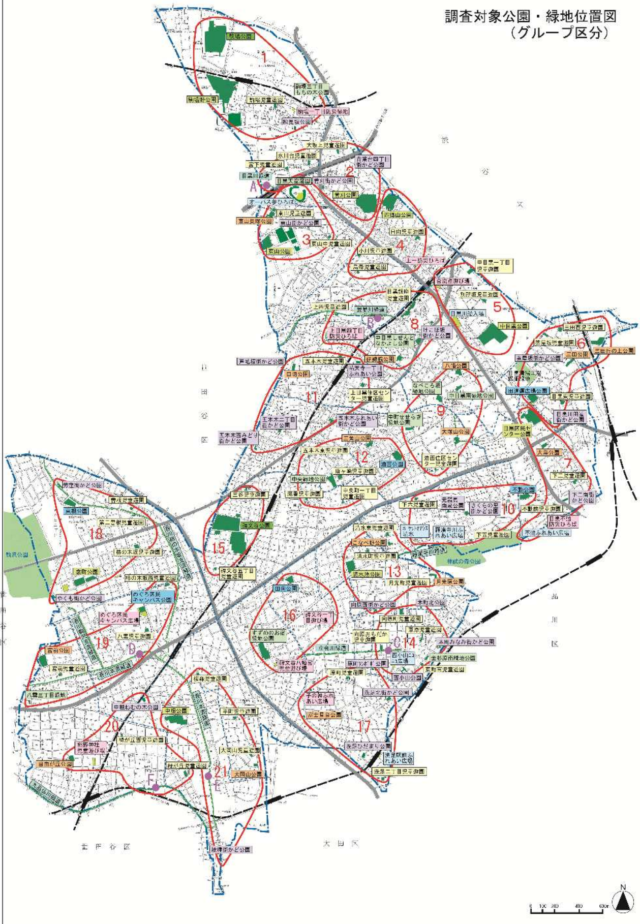
図 1 - 5 調査対象公園のグループ区分