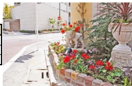
<道路沿い緑化の例>

区全体の面積の約7割は、民有地です。区では、民有地にみどりを増やすため、「みどりのまちなみ助成」を実施しています。助成により、2014（平成26）年度は、接道（道路沿い）152.84m、屋上・バルコニー283.93m 2 が新たに緑化されました。壁面緑化の助成はありませんでした。