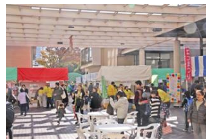
＜エコまつり🌿めぐろ2014＞

また、地域で、顕著な環境保全活動を継続して行っている区民、事業者及び団体等を顕彰する「エコ・チャレンジ顕彰」について、2014（平成26）年度は、3団体を顕彰しました。