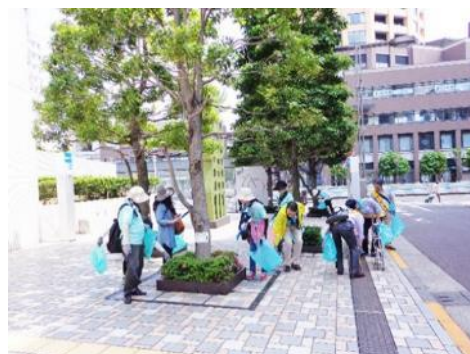
<「we love meguro」清掃美化活動>

また、犬のふん放置防止などのマナー向上のため、啓発プレートの配布と犬同伴の実技講習を開催したほか、苦情などについて相談対応を行いました。