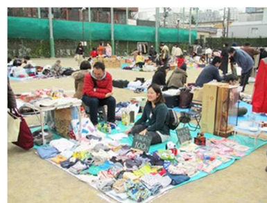
<フリーマーケット>

2014(平成26)年度は、フリーマーケット、リサイクル着物セールを行いました。