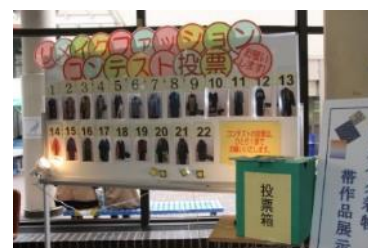
<リフォームファッションコンテスト>

環境に配慮した生活を提案するため、身近な体験を通して楽しく学べる、さまざまなテーマの講座・講習会を目黒区エコプラザにて開催しました。2014（平成26）年度に開催した講座・講習会は延べ56講座、1,662人の参加がありました。