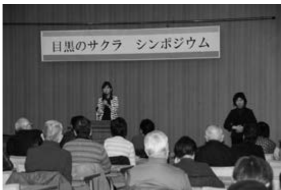
<目黒のサクラ シンポジウムの様子①>

目黒区では桜の保全と再生に向けて2013（平成25）年度に目黒のサクラ基金を設立し、美しい桜のある風景を後世に伝えていくためにどのように取り組んでいくか、皆さまと一緒に考えるため2014（平成26）年度に目黒のサクラシンポジウムを開催いたしました。当日は70名の参加者が出席し、桜の保全事業の内容や目黒川の歴史、また樹木医と区民の桜保全活動の内容について講師からお話を伺いました。