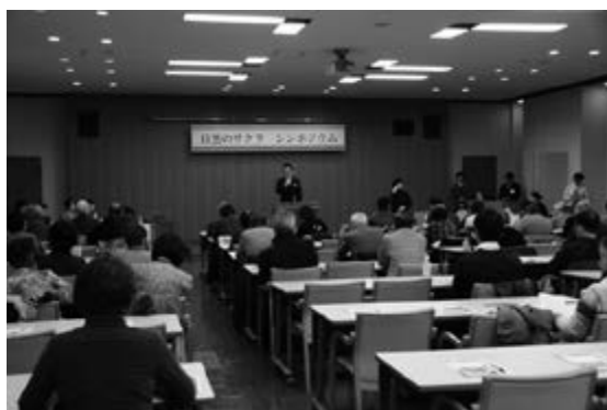
<目黒のサクラ シンポジウムの様子②>