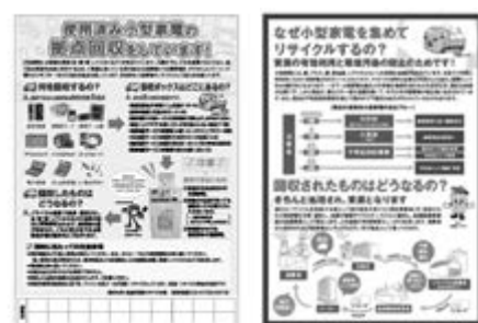
<小型家電回収パンフレット>