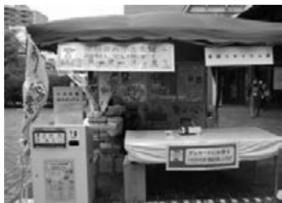
<消費生活展イベント>

また、町会等に使用済小型家電拠点回収開始のチラシの配布や目黒区総合庁舎内パネル展実施によって周知を図りました。