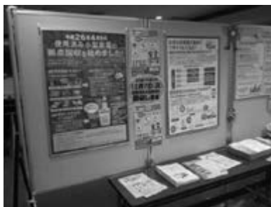
<目黒区総合庁舎内パネル展>