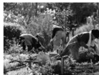
<グリーンクラブによる花壇の手入れ>

公園の清掃・花壇管理等の維持管理活動や、地域住民を対象としたイベントの企画運営を行うボランティア団体を公園活動登録団体として登録し、積極的に支援を行っています。2014（平成26）年度は17の団体が活動を行いました。