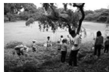
<東京大学で開催されたいきもの住民会議>

また、東京大学駒場博物館の「日本の蝶」展に共催し、それに合わせたスタンプラリーを東京大学駒場博物館、駒場野公園自然観察舎、中目黒公園の活動団体や花とみどりの学習館との協働で行うとともに、活動団体や自然通信員等の研修・交流の場であるいきもの住民会議についても、東京大学との共催で実施しました。