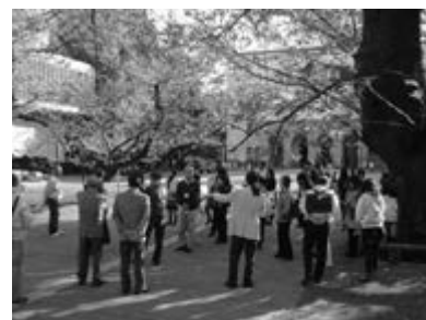
<フィールドワークの様子>