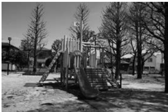
<東根公園の複合遊具>

区民の皆さまと検討会を行い、自由が丘公園、東根公園、大岡山児童遊園の改良工事を行いました。地域の皆さまのご意見を取り入れながら、遊具を取り替え、背のばしベンチを設置するなど、こどもたちがのびのびと遊び、地域の人が憩える明るい空間へとリニューアルしました。