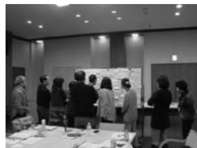
<ワークショップの様子>