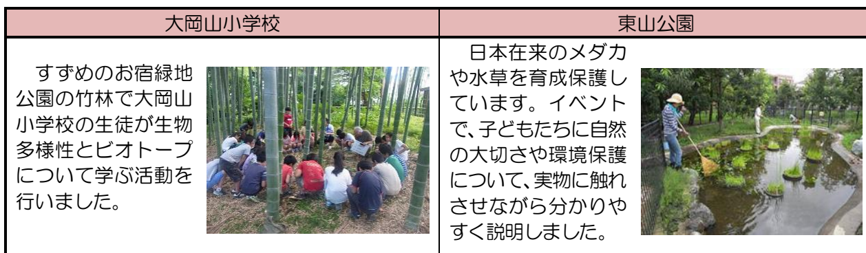
<ビオトープ活動状況>