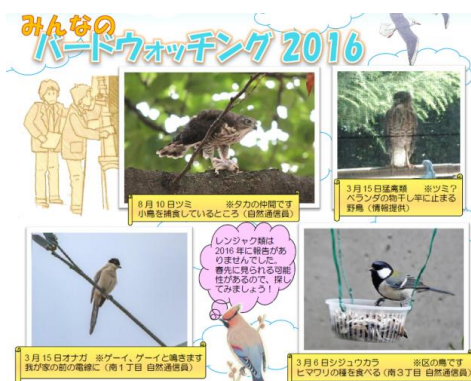
<自然通信員だよりの第59号より>

情報提供者には「自然通信員」としての登録を依頼し、自然通信員だよりの発行・送付により、情報の共有や継続的な参加を図ります。2016（平成28）年度末の自然通信員の登録は約1,100世帯で、延べ2,784件の情報が寄せられました。収集した情報は、区ホームページなどで情報発信しています。