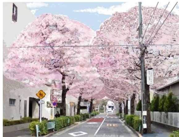
<田向円融寺通りの植替えイメージ> 両側植栽の間隔はソメイヨシノによる 千鳥配置で植替え