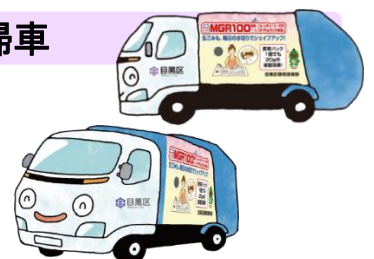
<ごみ減量キャラクターしゅーしゅーさん>

清掃車両側面に、ラッピングシートなどによる広報デザインを貼付しました。デザインは、「目黒区一般廃棄物処理基本計画」の目標や具体的な取組で区民の皆さんにPRできるものを掲載し、区の直営車11台が走行を開始しました。