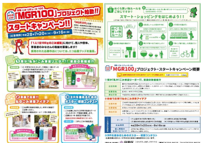
<「MGR100」スタートキャンペーンチラシ>

【応募結果】環境省ポスター(小学生) 1作品 東京都ポスター(小学生) 24作品 (高校生) 7作品 東京都 標語(小学生) 71作品