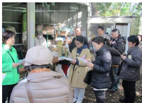
<第4回 生ごみ堆肥化施設の見学>