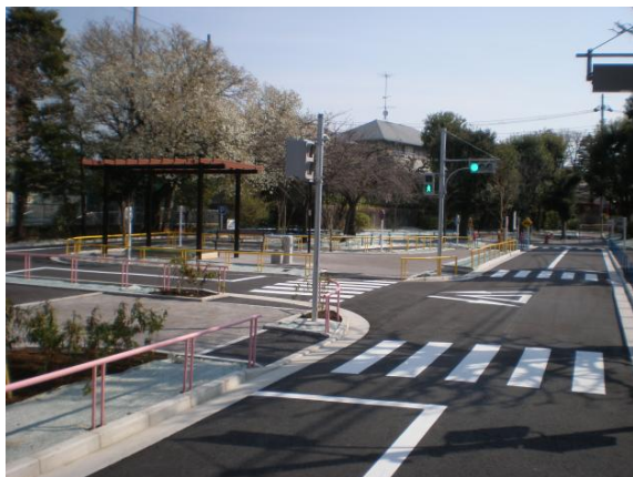
<衾町公園の交通施設>

区民の皆さんとの検討会をもとに、衾町公園交通施設、上四児童遊園の改良工事を行いました。地域の皆さんの意見を取り入れながら、遊具やトイレを更新するなど、子どもたちがのびのびと遊び、地域の皆さんが憩うことができる明るい空間へとリニューアルしました。