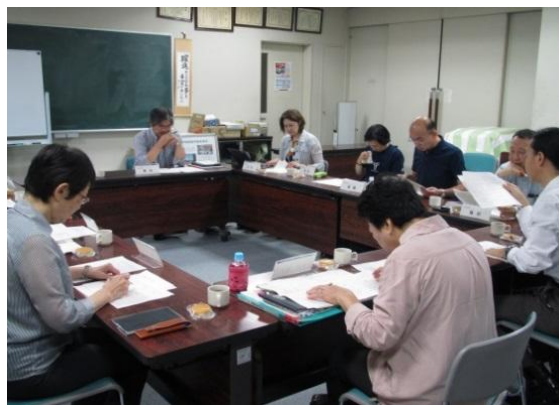
<企画委員会の様子>

修了後は、「めぐろエコサポーター制度」へ登録することができ、講座の企画や会報の作成、自主グループへの参加などの実践の場が用意されています。ここで1年間活動をすると、環境推進員として登録されます。