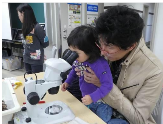
<顕微鏡での土のいきもの観察>