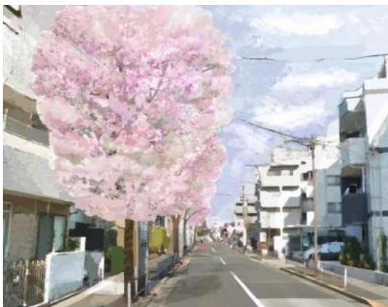
<碑さくら通りの植替えイメージ> ソメイヨシノとコシノヒガンザクラによる 植替え

基本的な方針として、樹勢が健全な桜についてはそのまま保全育成し、倒木の危険や枯損を生じた桜については、各路線の方針に従い順次植替えを行っていきます。