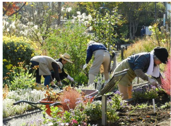
<公園活動登録団体による花壇の手入れ>