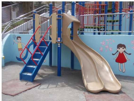
<上四児童遊園のすべり台>