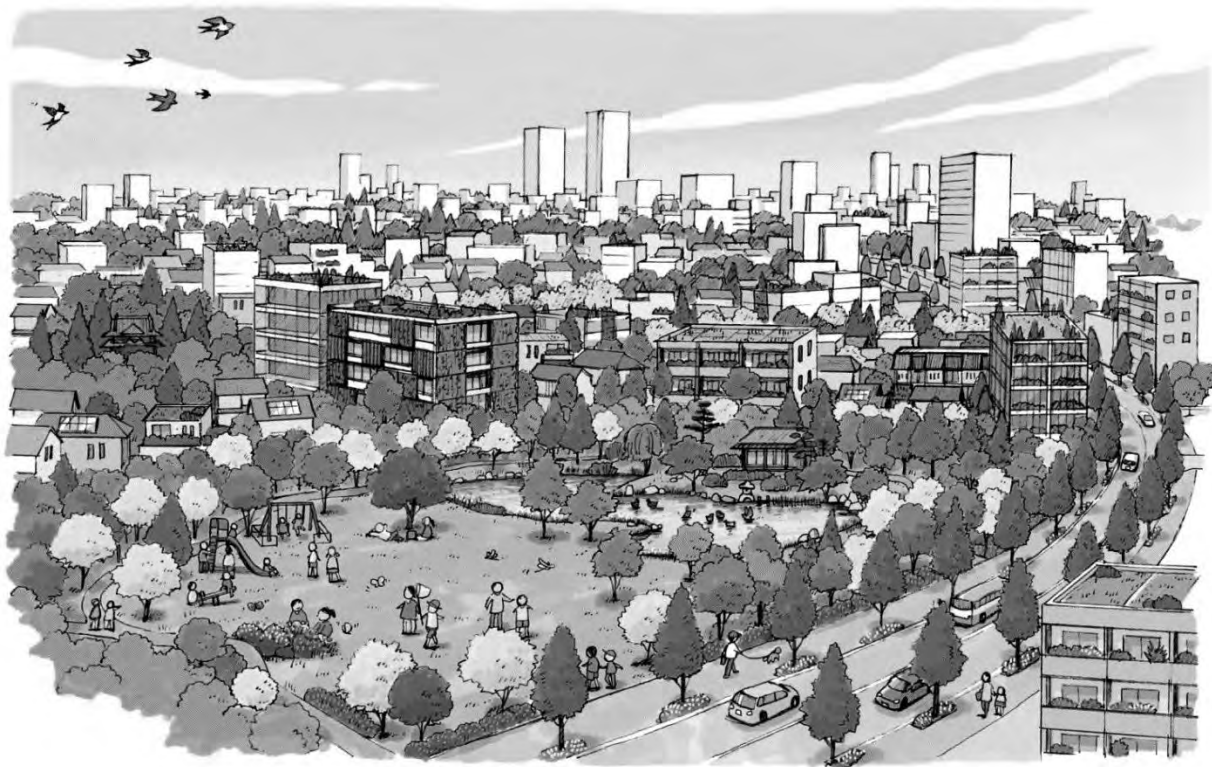
(イラストはイメージです)

こうした将来像を目標に、みどりの拠点となる公共施設等の緑地の保全、公園や緑道の整備、道路、河川沿川の緑化を進めるとともに、区民、事業者と協働して住宅地をはじめとする民有地の身近なみどりの保全や創出、育成に取り組み、まちに点在する樹林地や公園から住宅の庭までつながるエコロジカルネットワークを形成します。