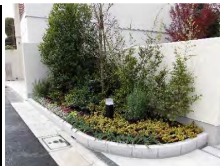
<道路沿い緑化の例>