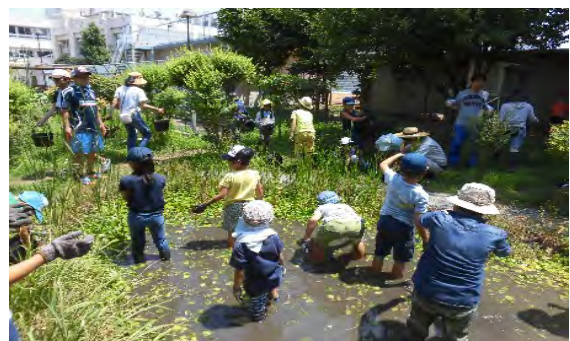
＜鷹番小学校でのビオトープ管理活動＞