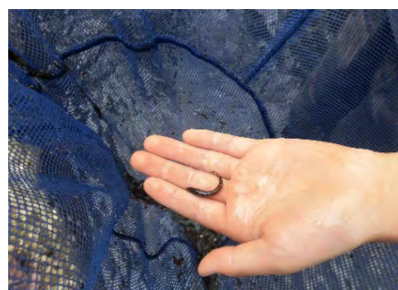
＜スミウキゴリ：目黒川＞