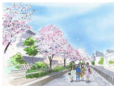
<呑川本流緑道の植替えイメージ> コヒガンとコシノヒガンによる植替え