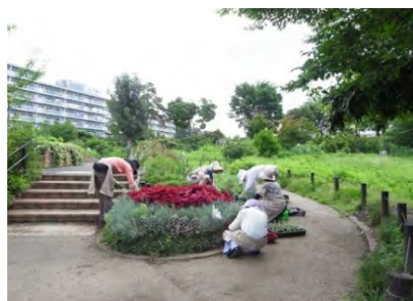
<住民参加による公園管理>

公園の管理には、住民ボランティアが関わり、花壇、雑木林、土壌、生物の生息環境の向上に寄与する質の高い公園管理を目指し、7つの公園で18団体が住民参加による公園管理を行いました。