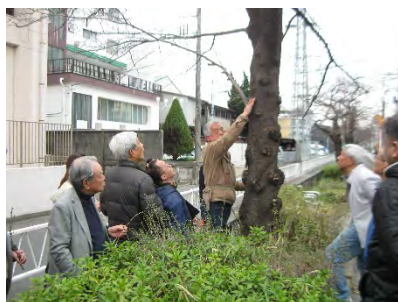
<サクラ保全事業報告会での調査>

基本的な方針として、樹勢が健全な桜についてはそのまま保全育成し、倒木の危険や枯損を生じた桜については、計画に従い順次植替えを行っていきます。