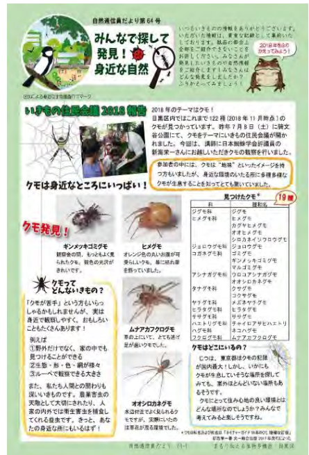
＜自然通信員だより第64号より＞