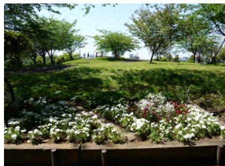
<グリーンクラブが手入れした花壇>

94団体に花苗を配布したほか、各住区のイベントなどで参加者にキンモクセイやアジサイ、ハギなど、合計1,100本の花苗を配布しました。