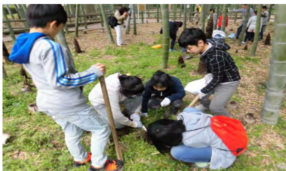
＜竹林での大岡山小学校の活動＞

大岡山小学校では、生徒が、すすめのお宿緑地公園の竹林で、生物多様性とビオトープについて学ぶ活動を行い、鷹番小学校では、児童や保護者、教職員などで学校内にあるビオトープの管理活動を行いました。