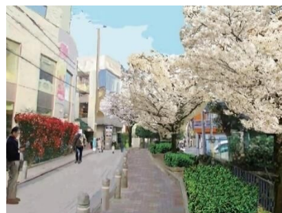
<九品仏川緑道の植替えイメージ> コヒガン、コシノヒガンによる植替え