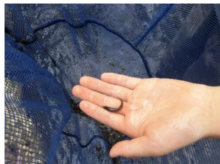
＜スミウキゴリ：目黒川＞