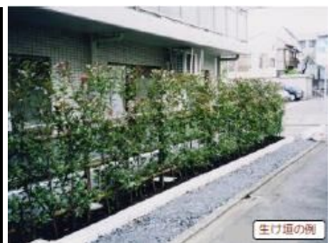
<道路沿い緑化の例>