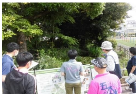
＜五本木小学校でのビオトープ管理活動＞

五本木小学校では、児童が、生物多様性とビオトープについて学ぶ活動を行い、鷹番小学校では、区職員により児童へ学校内にあるビオトープについての講義を行いました。