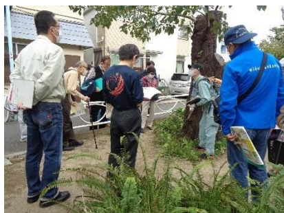
<現地調査会の様子> (九品仏川緑道)

基本的な方針として、樹勢が健全な桜についてはそのまま保全育成し、倒木の危険や枯損を生じた桜については、計画に従い順次植替えを行っていきます。