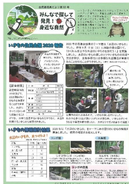
＜自然通信員だより第68号より＞