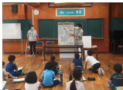
＜鷹番小学校でのビオトープ講義＞