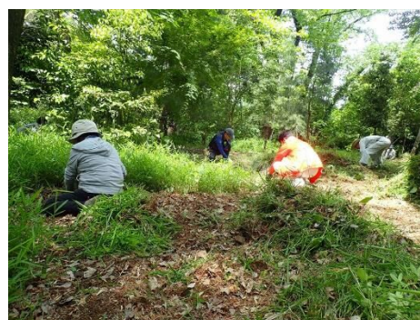
<住民参加による公園管理>

公園の管理には、住民ボランティアが関わり、花壇、雑木林、土壌、生物の生息環境の向上に寄与する質の高い公園管理を目指し、7つの公園で18団体が住民参加による公園管理を行いました。