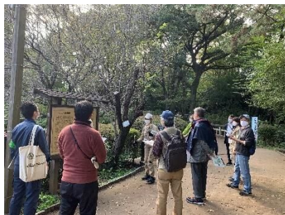
<現地調査会の様子> (駒場野公園)