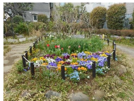
<グリーンクラブが手入れした花壇>

97団体に花苗を配布したほか、各住区のイベントなどで参加者にキンモクセイやアジサイ、ハギなど、合計820本の花苗を配布しました。