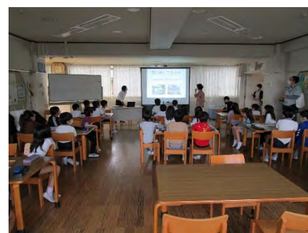
＜鷹番小学校でのビオトープ講義＞