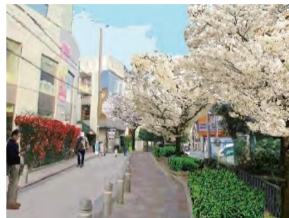
＜九品仏川緑道の植替えイメージ＞ コヒガン、コシノヒガンによる植替え