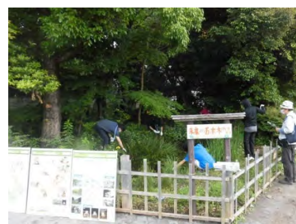
＜五本木小学校でのビオトープ管理活動＞

五本木小学校では、児童が、生物多様性とビオトープについて学ぶ活動を行い、鷹番小学校では、区職員により児童へ学校内にあるビオトープについての講義を行いました。