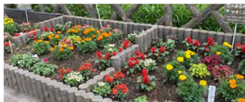
<グリーンクラブが手入れした花壇>

92団体に花苗を配布したほか、各住区のイベントなどで参加者にキンモクセイやアジサイ、ハギなど、合計1,100本の花苗を配布しました。