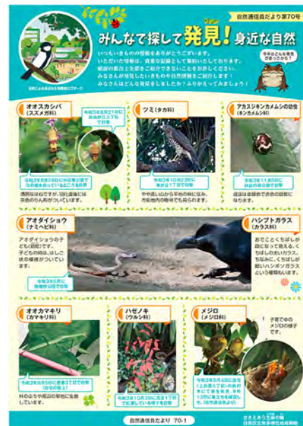
＜自然通信員だより第70号より＞