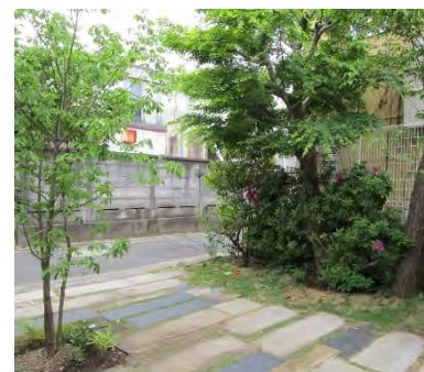
<道路沿い緑化の例>