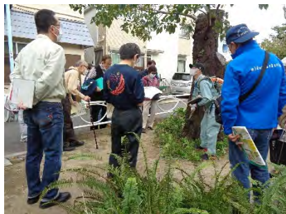
＜現地調査会の様子＞ （九品仏川緑道）

基本的な方針として、樹勢が健全な桜についてはそのまま保全育成し、倒木の危険や枯損を生じた桜については、計画に従い順次植替えを行っていきます。