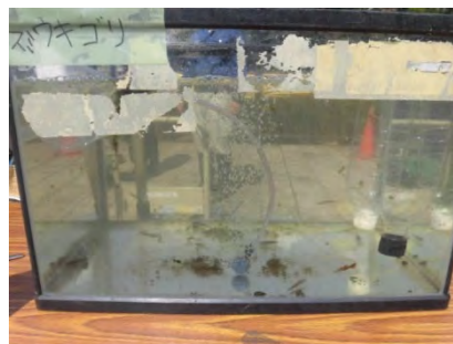
<スミウキゴリ：目黒川>