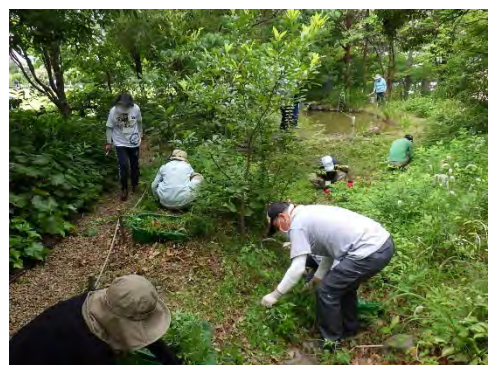
<住民参加による公園管理>

公園の管理には、住民ボランティアが関わり、花壇、雑木林、土壌、生物の生息環境の向上に寄与する質の高い公園管理を目指し、8つの公園で19団体が住民参加による公園管理を行いました。