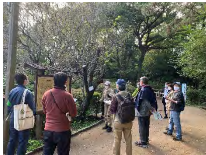
＜現地調査会の様子＞ （駒場野公園）