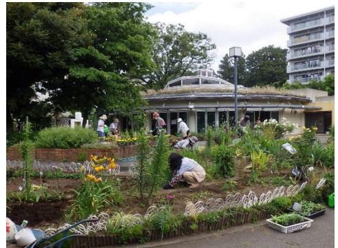
<グリーンクラブの活動>

2021（令和3）年度末現在92団体が活動しており、春（2月）・夏（5月から6月）・冬（11月）の年3回、区が配布する花苗を花壇に植え付け、色とりどりの草花でまちに彩りを与えています。