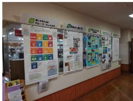
<エコまつり🌱めぐろ2021パネル展>