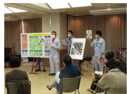
<環境推進員ステップアップ講座>

2021（令和3）年度は、「ごみ収集の現場から見る目黒のごみ事情」をテーマに、目黒区清掃事務所の職員を講師に迎え実施しました。また講座の様子は、当日参加できなかった方向けに動画に撮り、視聴できるようにしました。