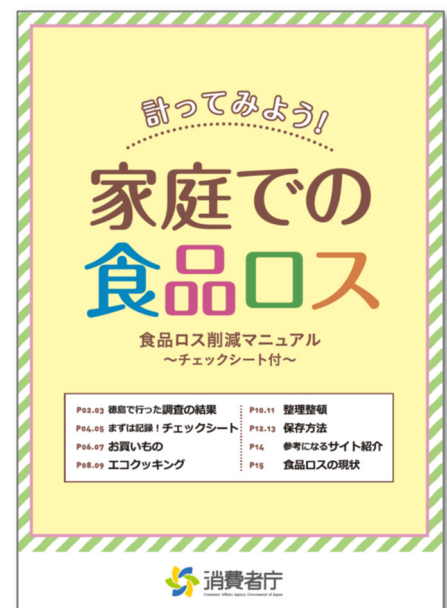
<「家庭での食品ロス」消費者庁発行>

常設の窓口の利用が少ない地域に対しても、イベントの中でフードドライブを企画していましたが、新型コロナウイルス感染症対策のため実施することはできませんでした。