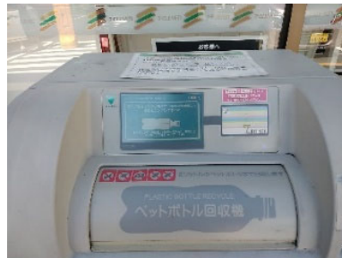
<在宅勤務が続く中での プラ回収>