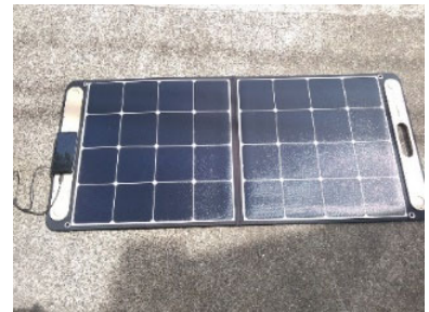
<ソーラーパネルを買ってみた>