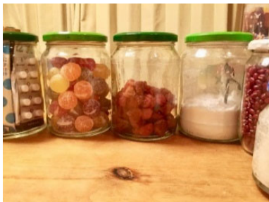
<便利なガラス瓶容器>

ホームページ内「実践わたし流！！」のページでは、読者が日ごろ実践しているエコなアイデアなどを掲載し、情報発信を行っています。