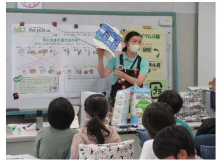
<小学校での出前講座の様子>

小学校へのお出前講座では、ごみ・リサイクルについて学ぶタイミングとなる4年生を対象として、エコライフめぐろ推進協会が作成した冊子「めぐろecoエコ大作戦」を教材に、日々の生活の中で資源の活用を身近に感じることができるよう、実物を示しながら、環境について考える機会を提供しました。