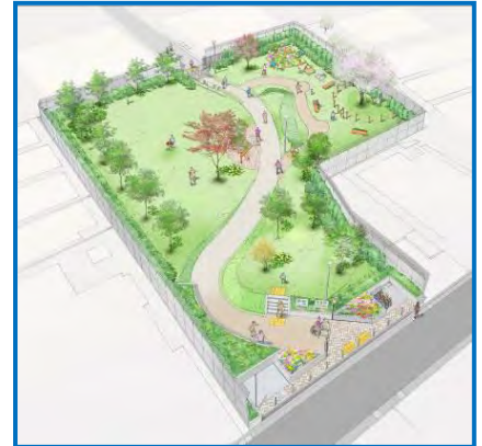
南一丁目緑地公園（仮称） イメージ図

平成29年度に住民検討会を開催して取りまとめた整備内容に基づき、平成30年10月の開設に向けて整備工事を行います。当該地の公園整備により、公園面積が約1,200㎡増加し、貴重なみどりの保全に寄与することができます。