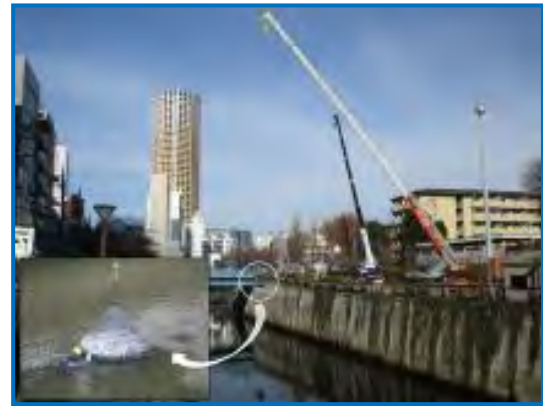
川底を均す工事の様子