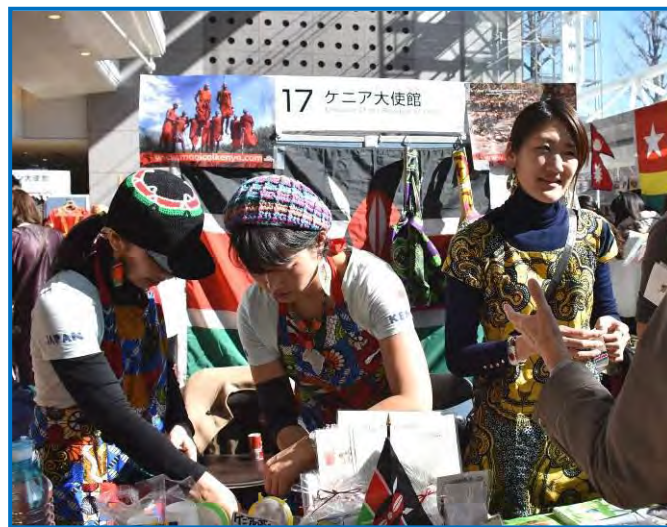
MIFA 国際交流フェスティバルの様子

多文化共生への取組は、公益財団法人目黒区国際交流協会（MIFA）等と連携を図りながら、英文情報紙の発行や、東京2020オリンピック・パラリンピック競技大会に向けた語学ボランティア育成などを進めていますが、平成30年度は、「多文化共生」への理解を深めるため、シンポジウム等を開催します。