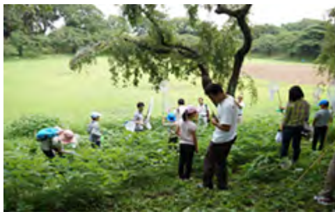
東大で実施したいきもの調査

また、樹木の減少に対応するため保存樹木の新規指定を再開し区内の樹木の保全を図ります。屋上の緑化を推進してヒートアイランド等都市環境の緩和を図りながら、エコロジカルネットワークの保全と形成に取り組んでいきます。そして、生物調査等への区民参加を更に促進するなど区民との連携を進めながら、身近な自然を守り未来に伝えていくまちづくりを行っていきます。