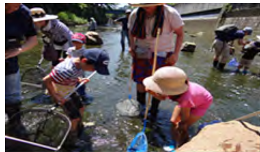
目黒川で魚の調査をする家族（いきもの発見隊）