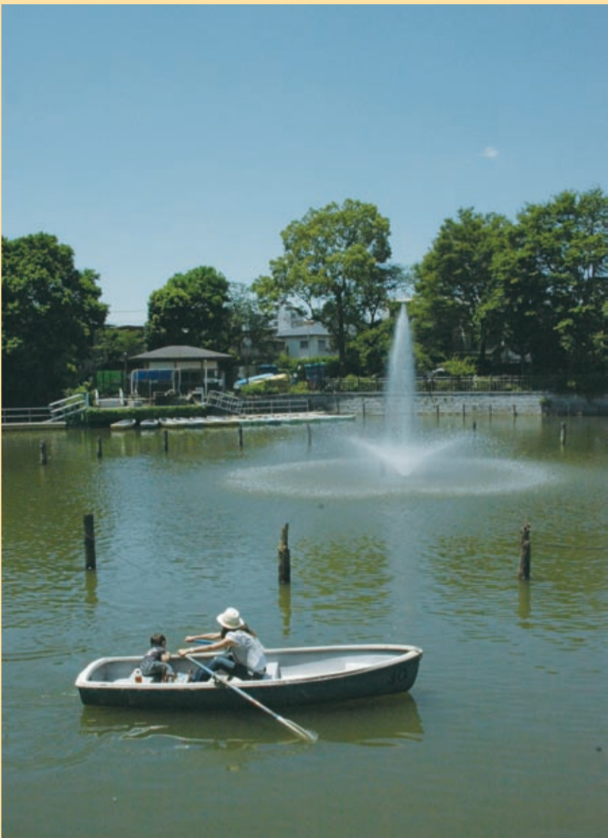
水辺の風景 (碑文谷公園にて)