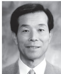
伊藤よしあき議長