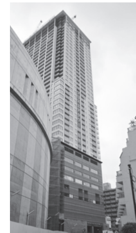
中央がクロスエアタワー

平成24年6月13日、企画総務委員会を初めとする4つの常任委員会は、東京都の都市計画事業で大橋地区第二種市街地再開発事業1-1棟のクロスエアタワーを視察しました。 工事中の同施設には、大橋図書館、北部地区サービス事務所、北部包括支援センターの各公共施設が入居するほか、防災高所カメラが設置され、平成25年2月に開設される予定です。