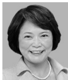
しいじま和代議員