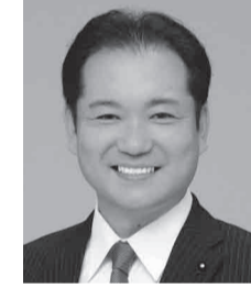
山宮きよたか議員