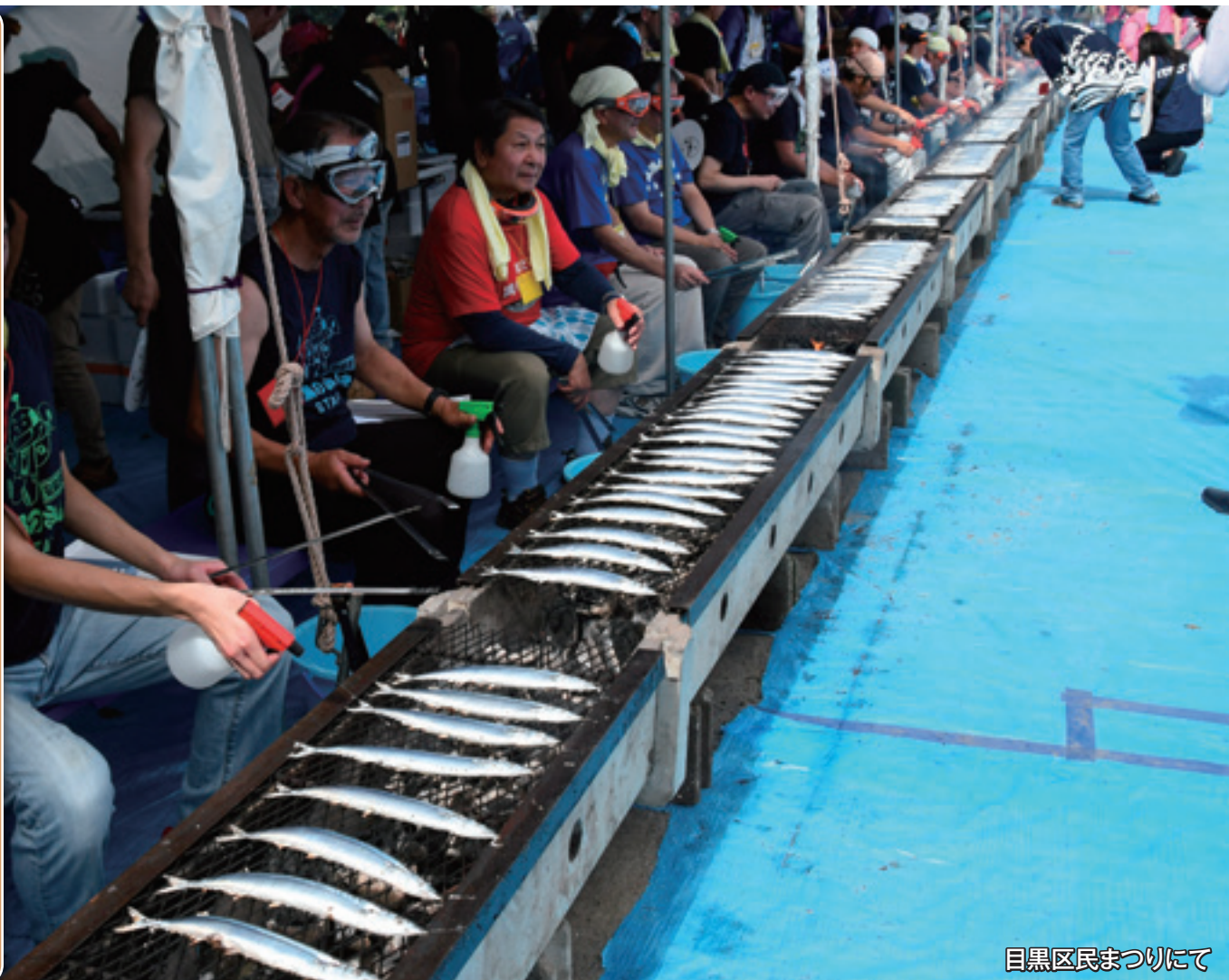
目黒区民まつりにて

令和元年第3回定例会 平成30年度一般会計等歳入歳出決算を認定 令和元年度一般会計等補正予算を可決 会計年度任用職員の給与及び費用弁償に 関する条例ほかを可決