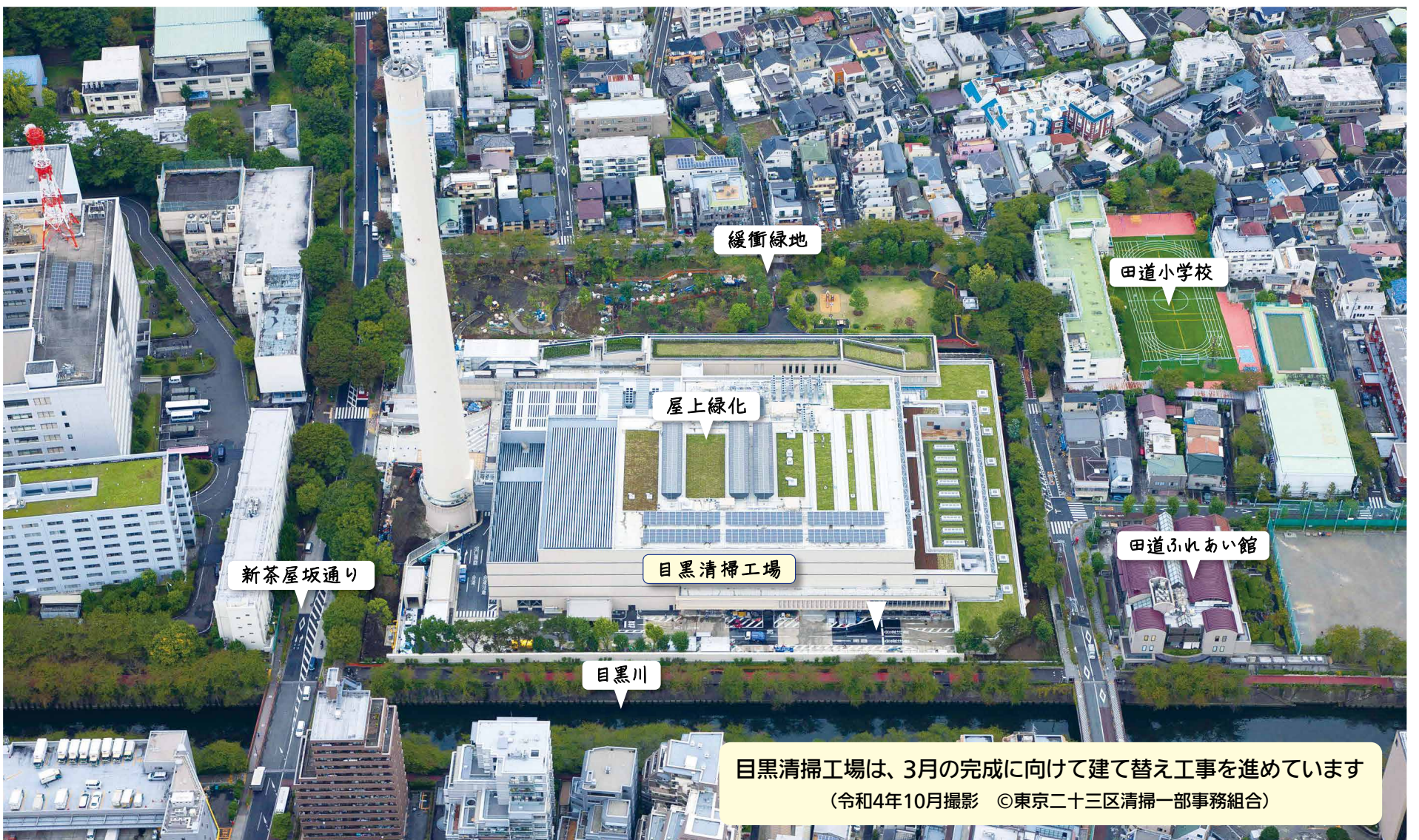
目黒清掃工場は、3月の完成に向けて建て替え工事を進めています (令和4年10月撮影 ©東京二十三区清掃一部事務組合)