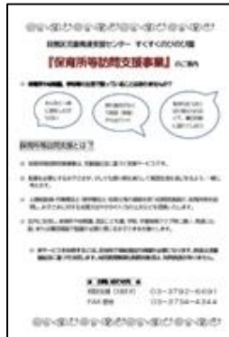
保育所等訪問支援チラシ