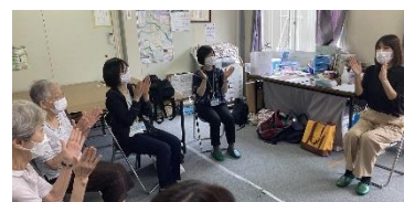
出張相談・ミニ講座・居場所づくり