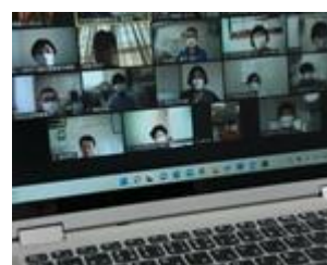
コロナ禍オンラインを使用した 関係機関との連携

令和2年度から3年度にかけては、新型コロナウイルス感染症の影響により、出張相談及び地域ケア会議の開催回数が減、また各種講座やイベントが中止となった。