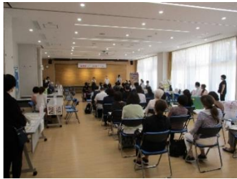
めぐろ福祉しごと相談会の様子