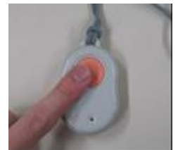
非常通報システム ペンダント型通報機