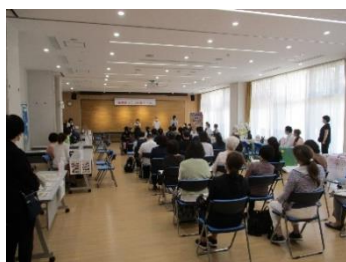
めぐろ福祉しごと相談会の様子