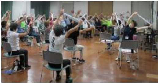
【事業終了後、活動を継続するグループの様子】

介護予防の知識を学び、事業終了後は参加者がめぐろ手ぬぐい体操やウォーキング活動を行うグループとなり、介護予防・フレイル予防を続けることをめざす。