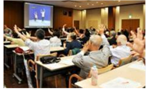
令和元年度に実施した地域デビュー講演会