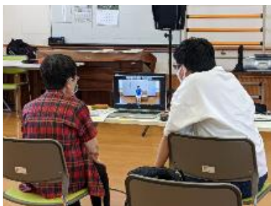
【オンラインによるフレイル予防の様子】

オンラインを利用した介護予防教室を実施。オンラインに不慣れな方、初めての方でも参加しやすいよう、事前にオンライン操作説明会を実施している。