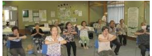
地域交流サロンで実施した体操教室

※2：新型コロナウイルス感染拡大防止のため、令和2年度は10～11月のみ実施、令和3年度は4月のみ実施、令和4年度は中止した。