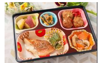
配食サービス・配食例