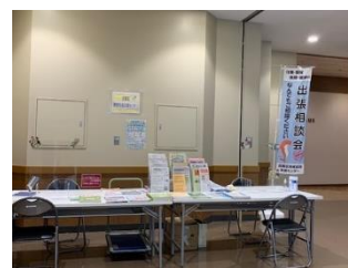
商業施設での出張相談会