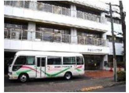
目黒区児童発達支援センター