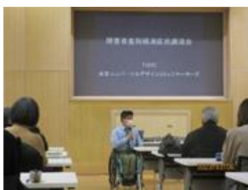
差別解消区民講演会