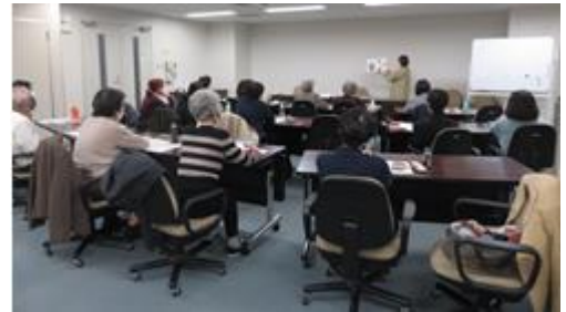
令和3年度に実施した「りぷりんと」

※令和3年度から事業開始（令和2年度から事業開始予定であったが、新型コロナウイルス感染拡大防止のため令和2年度の開催は見送った）