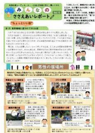
ささえあいレポート発行