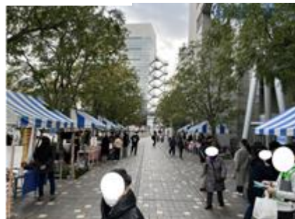
区内障害福祉施設及び障害者団体の自主生産品の販売