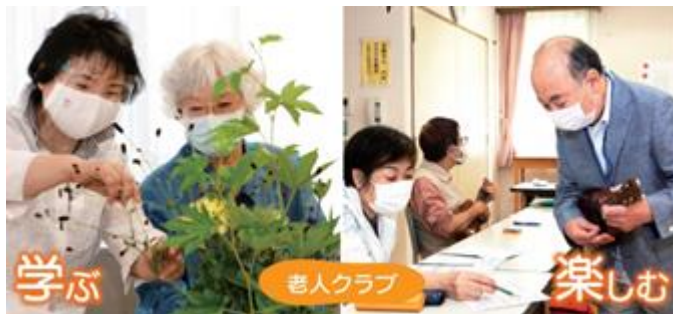
老人クラブの活動風景(令和3年9月15日号区報から)