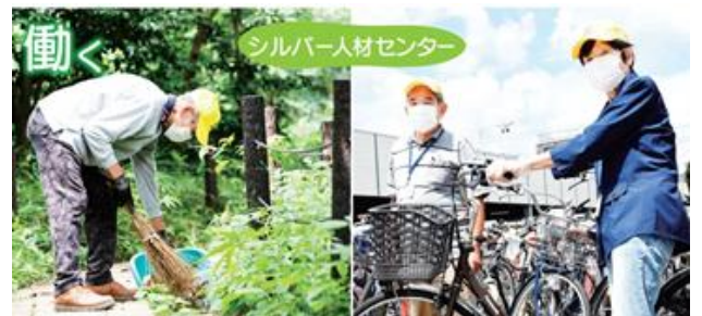
シルバー人材センター会員の就業風景（令和3年9月15日号区報から）