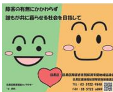
啓発グッズ（カイロ、ポケットティッシュ）