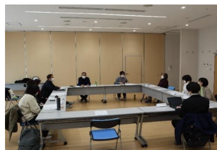
基幹相談支援センター事例検討会の様子