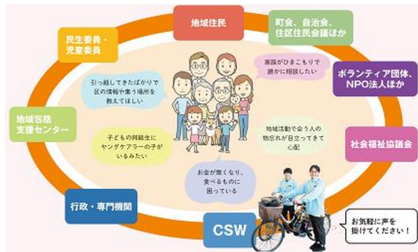
CSWの活動イメージ図