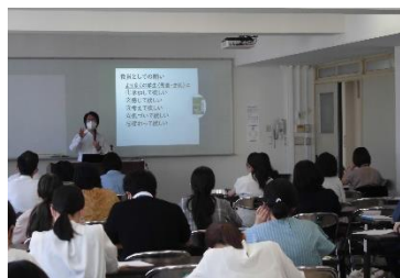
特別支援教育研修