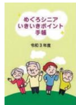
めぐろシニアいきいきポイント手帳