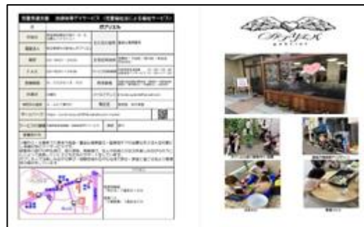
めぐろの発達支援事業所等リストブック