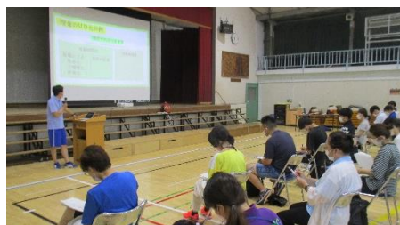
若手教員向け「初任者研修」 の障害に関する講座