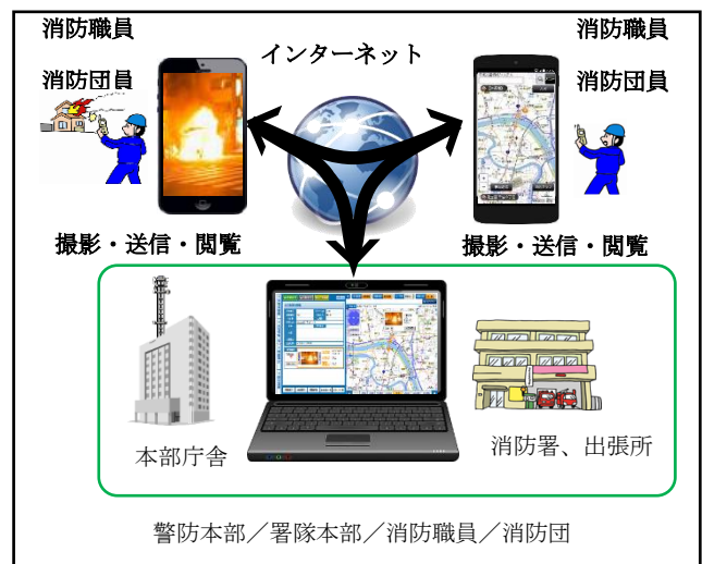
早期情報収集システム

消防職員、消防団員が参集途中に災害を発見した際、スマートフォンや携帯電話で撮影した災害現場等の写真を地図上で情報共有するシステム