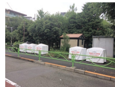
土のう拠点場所 （東山公園拡張部）