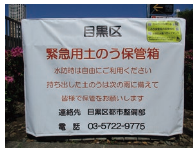
緊急用土のう保管箱