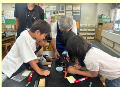
科学実験教室（くらりか）