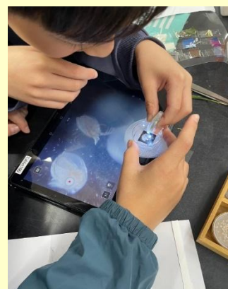
モバイル顕微鏡でミクロの世界を見てみよう