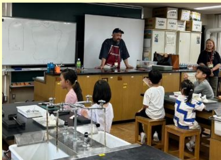
本革ミニ財布を作ろう！

申込手続き等問い合わせ先 KIPP中目黒 kipp.nakame@gmail.com https://www.kippnakameguro.com/