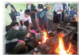
飯ごう炊さんの様子