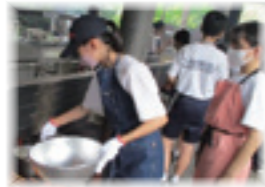
飯ごう炊さんの様子