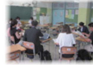
(第七中学校・第九中学校)