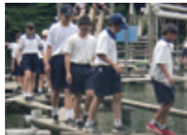
アスレチックの様子

第七中と第九中で、千葉県野田市にある清水公園で合同校外学習を行いました。実行委員が中心となりスローガンを決めたり、会の司会等の役割を担ったりしました。