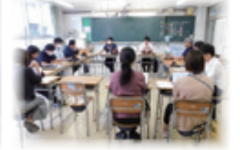
(第八中学校・第十一中学校)