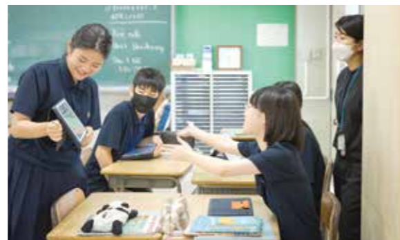
チーム・ティーチングの様子