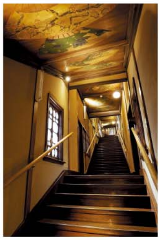
東京都指定有形文化財 ホテル雅叙園東京「百段階段」

ウォーキングマップの紹介スポットには指定文化財がある施設もあります。見学の際には、文化財を傷つけたり、公開されていない場所や個人の敷地に立ち入ることのないようにマナーを守りましょう。