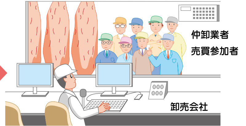
仲卸業者 売買参加者 卸売会社