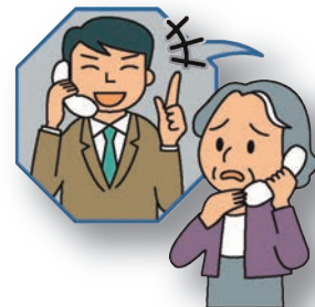
しつこい電話勧誘