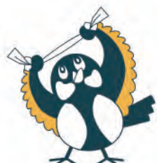
目黒区介護予防 マスコット シジュウカラの 「しじゅちゃん」

シニア健康応援隊（介護予防リーダー）が運営する、めぐろ手ぬぐい体操の拠点は、いつからでも、どなたでも参加可能です。（満員の場合をのぞく）