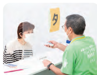
測定機器でフレイル状態チェック！