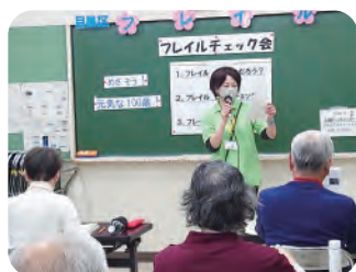
フレイル予防について、ポイントを説明します！