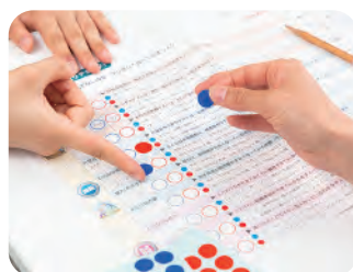
赤青のシールを貼って、フレイル状態をチェック！