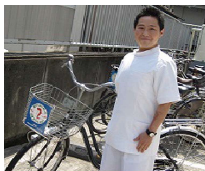
指圧処 与楽(五本木2丁目)

目黒区内を中心に自転車で各家庭を回って訪問マッサージを提供しています。訪問してひとりぐらしに不安があると話す高齢の方に、包括支援センターで相談にのってくれと声をかけたところ、良いサービスにつながったと、とても喜んでおられました。また、以前、通りすがりに郵便物がたまっているのを見かけたことがあり、今度見かけたときは 見守りめぐねつと の協力事業者として連絡しようと思っています。