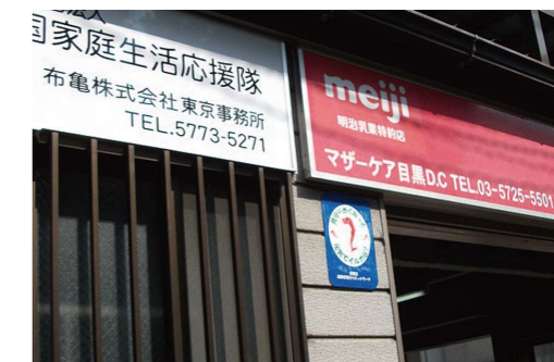
布亀株式会社 マザーケア目黒デリバリーセンター (碑文谷2丁目)

昨年度より 見守りめぐねつと に参加しています。もともとは全国で配置薬の事業をしており、お客さまの健康を考えることを本質に事業を行っています。牛乳をお届けする際にも、声かけなどを行なって健康管理や異変に気付くようにしています。また、地域を配達で回る際にも、以前利用いただいていたお客さまなど、気になる方を見かけた時には声かけや見守りを行っています。