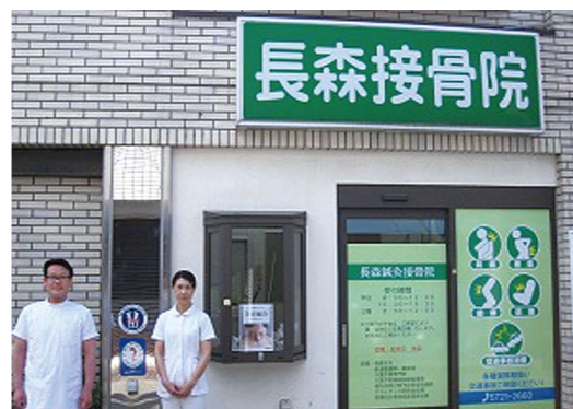
長森接骨院(下目黒3丁目)