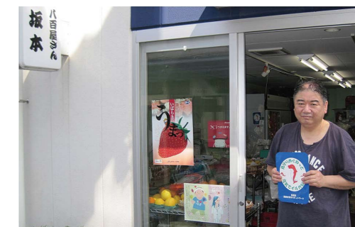
坂本商店(中根1丁目)

この地域で親の代から開業しているので、私が子供の頃からの常連さんがたくさん来店されます。その中には、最近体調が悪くて来店頻度が減っている方や、家族が近くにいない一人暮らしの方など、気になる方もいます。また、他のお客様からご心配な高齢の方の近況を聞くこともあるので、必要な時は包括支援センターに相談しています。今後も地域の皆さんが、元気に過ごせるように 見守りめぐねつと の協力事業者としてお役にたてればと思います。