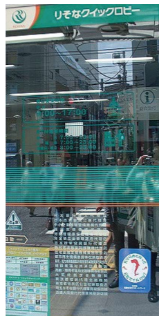
りそな銀行 中目黒 支店 (上目黒3丁目)

昭和17年に中目黒で開設し、70年以上の歴史のある銀行です。近年ご高齢のお客様が増えています。認知症サポーター養成講座を受講して以来、お客様へのお声かけの工夫や、対応について気を配っています。また金融被害に巻き込まれないように警察とも協力しながら見守りを行っています。今後も地域の銀行として、 見守りめぐねつと 登録事業者として見守り活動を続けていきます。