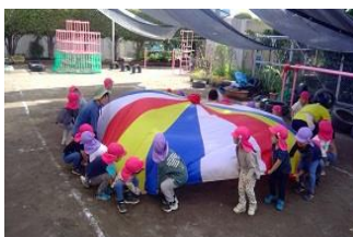
ミニ運動会をしました