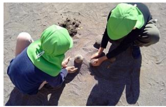
泥だんご、上手にできるかな