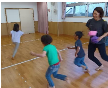
保育士が追いかけてボールを当てます。当たらないように考えながら逃げています。(5歳児クラス)