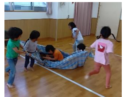
布の端を持ちぐるぐると回ります。布の上にいる子は、向きをかえたり体を動かしたりしています。

幼児クラスはじゃれつき遊びや、昼寝明けに毎日異年齢でリズム遊びをしています。異年齢の姿に刺激されながら体を動かすことを楽しんでいます。