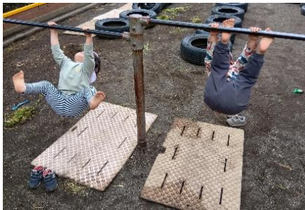
鉄棒にぶら下がり足をぐーんと持ち上げられるようになっています。(2歳児クラス)