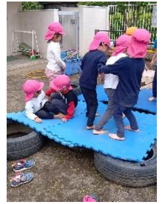
タイヤやマットも組み合わせて面白い遊び場に変身しました。トランポリンのようにジャンプして楽しんでいます。

全園児が同時に園庭に出る機会もあり、そこから異年齢の交流も育まれています。5歳児クラスの子が乳児クラスの子のそばに行き保育士から聞いた名前を呼んで「可愛いね」と言っています。時には砂に触れている子に泥のお団子を手渡し、異年齢の交流ならではのやりとりが見られます。