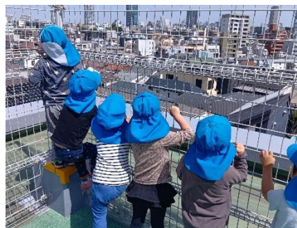
追いかっこや、だるまさんが転んだをして広い空間でのびのび体を動かす遊びを楽しんでいます。

開放感のある屋上では三輪車やコンビカーに乗ったり、保育士と一緒に追いかっこや鬼ごっこ、縄跳び等をしたりして体を動かして遊んでいます。