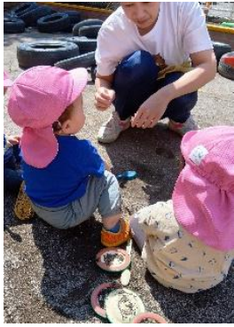
安心できる保育士と一緒に砂の感触を楽しんでいます。(0歳児クラス)