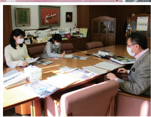
インタビューの様子