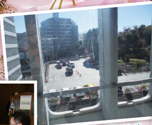
区長室の窓からの眺め