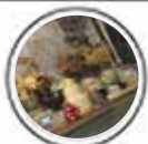
Chou de ruban