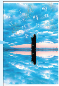
『晴れ、時々くらくらげを呼ぶ』 著：鯨井 あめ (講談社)

おすすめポイント...等身大の高校生が描かれています。今の生活に不満がある中高生、青春を感じたい大人にオススメです。表紙がキレイです。(彩葉)