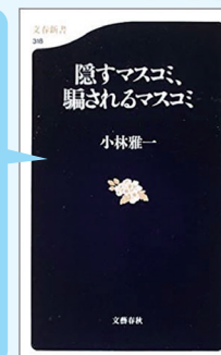
『隠すマスコミ、騙されるマスコミ』 著：小林 雅一 (文春新書)

おすすめポイント...与えられた情報をすぐ鵜呑みにせず、しっかり因果関係を把握して確認することが、どれだけ大切なのか再確認できる本です。(晴起)