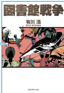
『図書館戦争』 著：有川 浩 (メディアワークス)