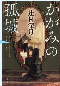
『かがみの孤城』 著：辻村 深月 (ポプラ社)

おすすめポイント...小学生の時に読んで本ですが、中学生になってから読んで、新たな発見があり、どの世代が読んでも楽しめるファンタジーです。(結衣)