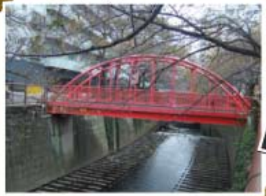
中の橋 青葉台3丁目辺り ロングバケーション ラストクリスマス ホタルノヒカリ