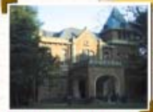
旧前田侯爵邸洋館 駒場4-3-55(目黒区駒場公園内) のだめカンタービレ 華麗なる一族 ライアーゲーム