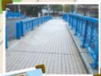
田楽橋 中目黒2丁目辺り プロポーズ大作戦 エースをねらえ ラストクリスマス ライフ