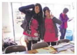
取材の合間に受付のお手伝い、っていうか、受付の合間に取材？

★エントランスにはさまざまなコーナーが、「めぐろ・はあと・ねっと」による「目黒区子ども条例啓発コーナー」もありました。