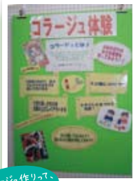
コラボジュワリーって、楽しいね♪