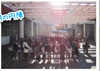
▲ティーンズ・フェスタの成功に向け、円陣を組みます。早期の区民センターにて