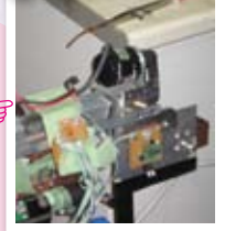
▲びくびく動く、人工筋肉(肉内)のものらしいです。これは金が売られてい るらしい。高そう、動くコップに見 えなくもない、使い方はひみつ、