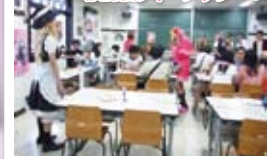
▲まず目にとまったのはコスプレ喫茶。アニメ好きにはたまりません!