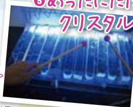
▲澄んだいい音がしました。みんな たたきました。素材が手に入らず、 なかなか作れないそうです。