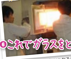
▲この装置で、ガラス をたたきました。 ③mくらい離れた所 でも熱かったです。