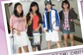
▲今日は海堂薫（テニスの王子様）の格好をしていました。友達とこういう格好がよく出かけるそうです。楽しんで！