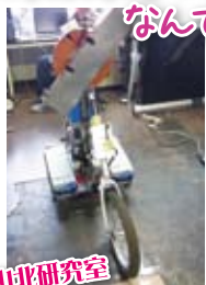
▲山北研究室バイクロボット 上につけてこれをパラソルと とっているそうです。分かります 説明していただきましたが、中学生 の私には難しかったです…