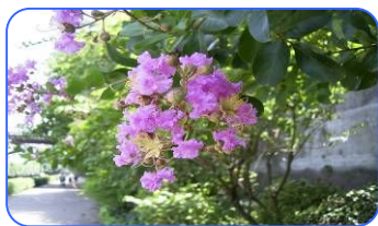
呑川本流緑道のサルスベリ