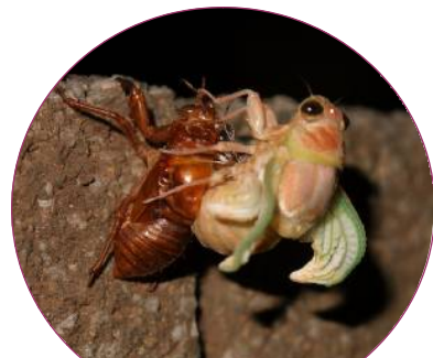
8月1日。8匹のセミが羽化しているところに出くわしました（目黒2丁目通信員）