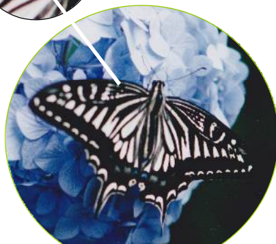
6月10日ナミアゲハ （碑文谷6丁目通信員）