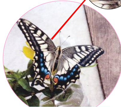
6月末。キアゲハ （上目黒5丁目通信員）