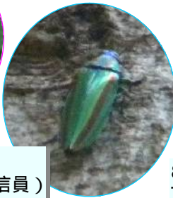
8月2日タマムシ 駒場野公園（自然通信員）