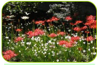
碑文谷公園のヒガンバナ