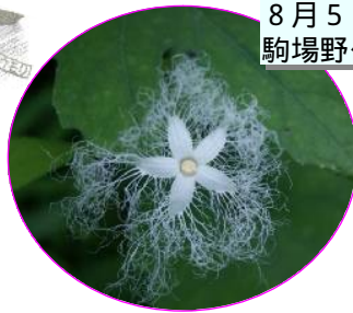
8月5日カラスウリ開花 駒場野公園（自然通信員）