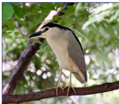
6月26日ゴイサギ。区民キャンパス。枝に止まったまま静かにしていました（八雲4丁目通信員）