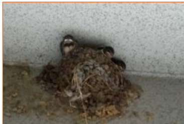
8月6日ツバメ。3度の巣の崩落を乗り越えた新しい命の誕生です。ツバメのすさまじい生命力に圧倒されました（中目黒5丁目通信員）