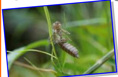
4月29日クロスジギンヤンマの抜け殻。その後、羽化した付近でアリにたかられているヤンマの成虫の死骸を発見しました。(自然通信員)