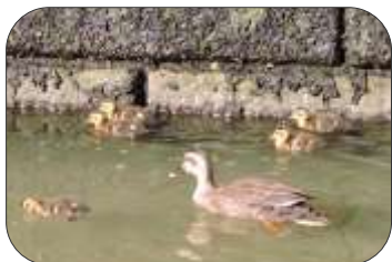
カルガモの親子（目黒川田楽橋の下）