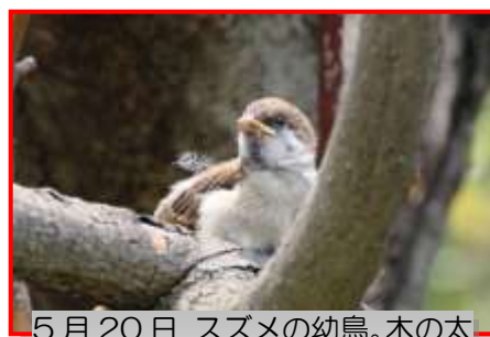
5月20日 スズメの幼鳥。木の太い枝に留って、ピーピー鳴いていました。(緑が丘にて自然通信員)