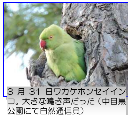
3月31日ワカケホンセイインコ。大きな鳴き声だった(中目黒公園にて自然通信員)

エナガは平地から山地の林に生息する、日本一くちばしの短い鳥。東京都のレッドリスト(2013年)では非分布とされているため、偶然目黒区を訪れたようです。