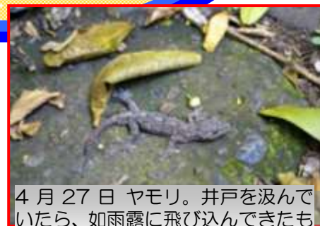
4月27日 ヤモリ。井戸を汲んでいたら、如雨露に飛び込んできたものです。(南3丁目自然通信員)